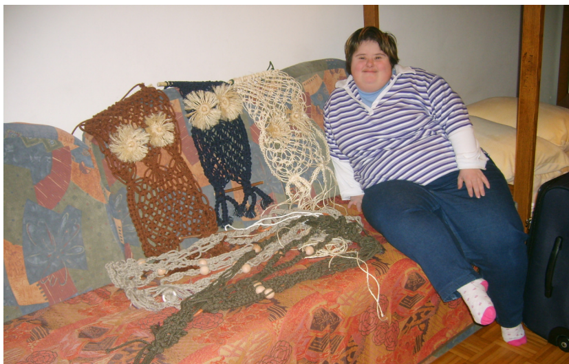
Zapisala Minka Rizvič

Drugi dan smo hotele nadaljevati, pa ni šlo, ni šlo. Spomnila sem jo naj dvigne kiklico, takoj je vedela kaj mora narediti in izdelek je bil tu. Pa pogledjte kaj vse smo naredile v delavnicah v Izoli.