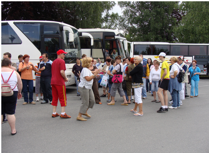
Izstopanje iz avtobusa in zadnje informacije.

kavici. Pot smo nadaljevali proti Tržiču (tu je bila včasih velika tovarna obutve) in naprej proti mejnemu prehodu Ljubelj, vendar nas niso ustavili, ker na meji ni več policistov in carinikov. Po vijugasti cesti smo se spustili čez prelaz proti Celovcu.