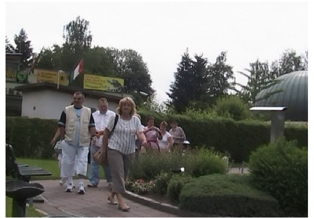
Ogled in slikanje v Minimundusa.